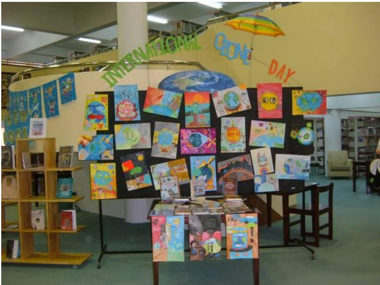
An art display in the school library features the student work on Ozone Layer Depletion, and submissions to the International Ozone Day art contest. Many of the designs have been used as school awareness materials including the Phase-Out concert flyer, stickers to raise funds for non-HCFC air conditioning, and the International Ozone Day t-shirt.