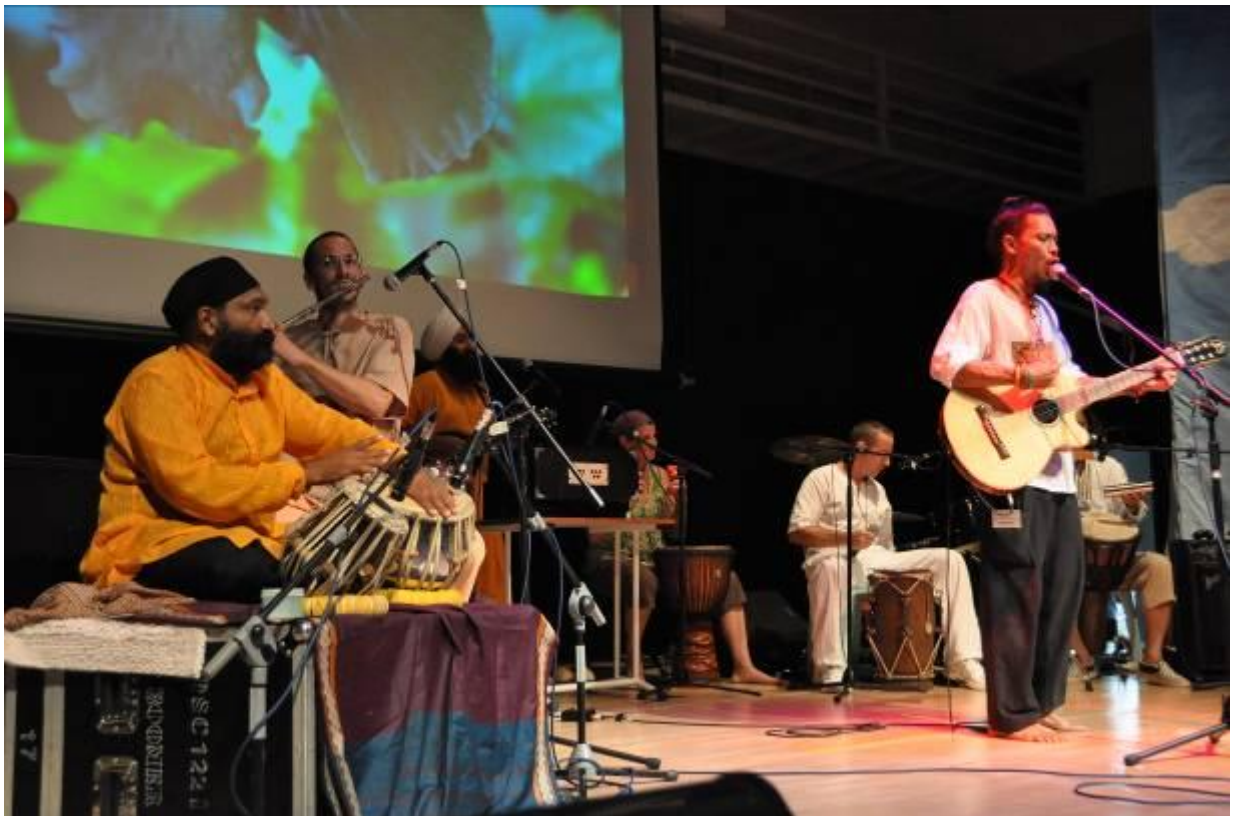
International sensation Kaya Green Band joins International Ozone Day, performing Fix That Hole .