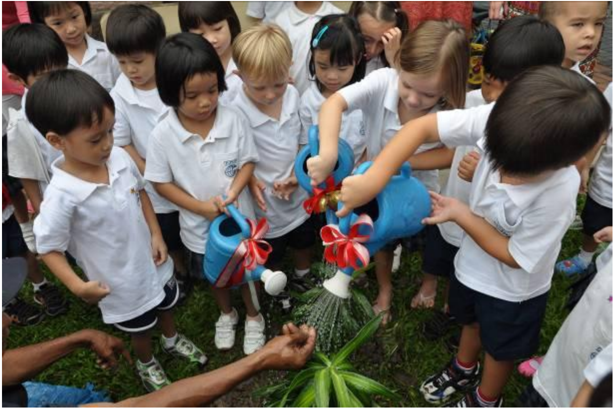
Elementary students lovingly water their indigenous sapling while attending the Tree Planting workshop, part of the UNEP Plant for the Planet: Billion Tree Campaign.