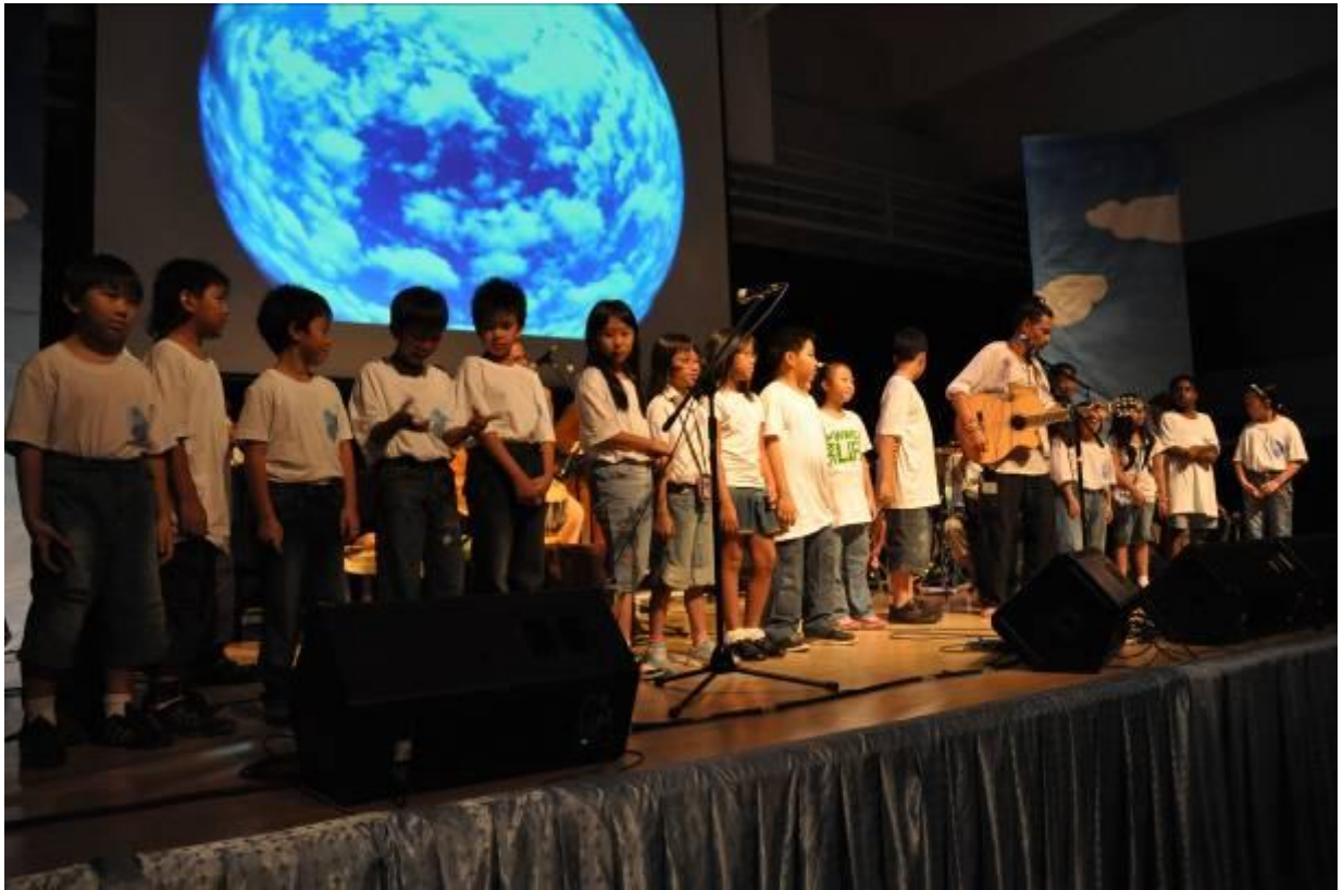
Ozone Presentation by RIS Middle School, led by a member of the Kaya Green Band.