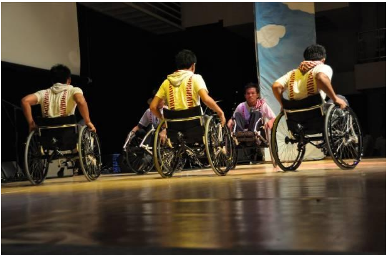
Love Utility Dance by the Pattaya Vocational School, one of the many guests invited to participate in the Thailand International Ozone Day celebration at RIS.