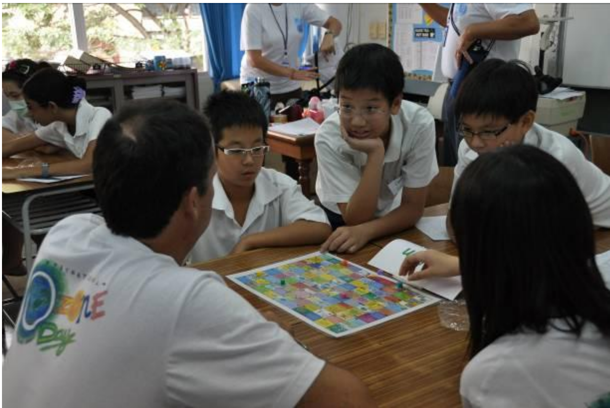
Middle school students attending UNEP Curriculum in Action play Snakes and Ladders, a facts and trivia awareness game found in the OzonAction Education Pack.