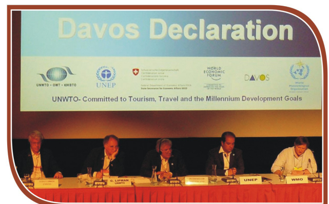
Deuxième conférence internationale sur le changement climatique et le tourisme, 2007