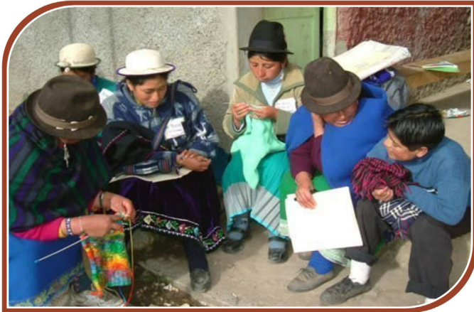
Micro-entrepreneurs du tourisme lors d'une session de formation du projet en Équateur.