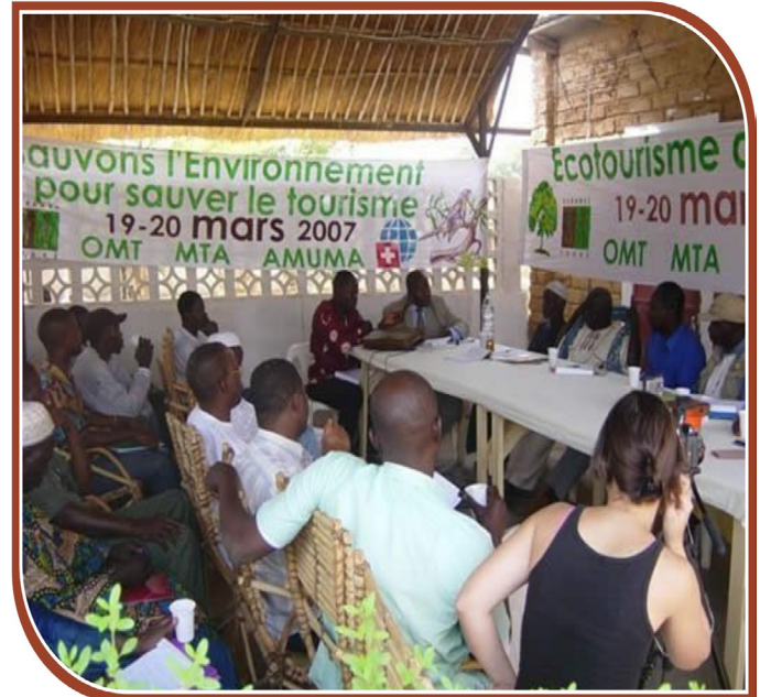
Un atelier sur l'écotourisme conduit dans le cadre d'un projet ST-EP au Mali.